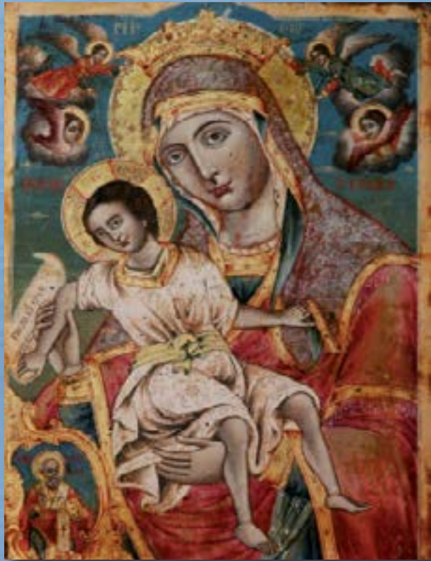
Ἡ Ἐφέστιος Ἰ. Εἰκόνα τῆς Παναγίας τῆς Ἰ. Μονῆς Κουδουμᾶ.