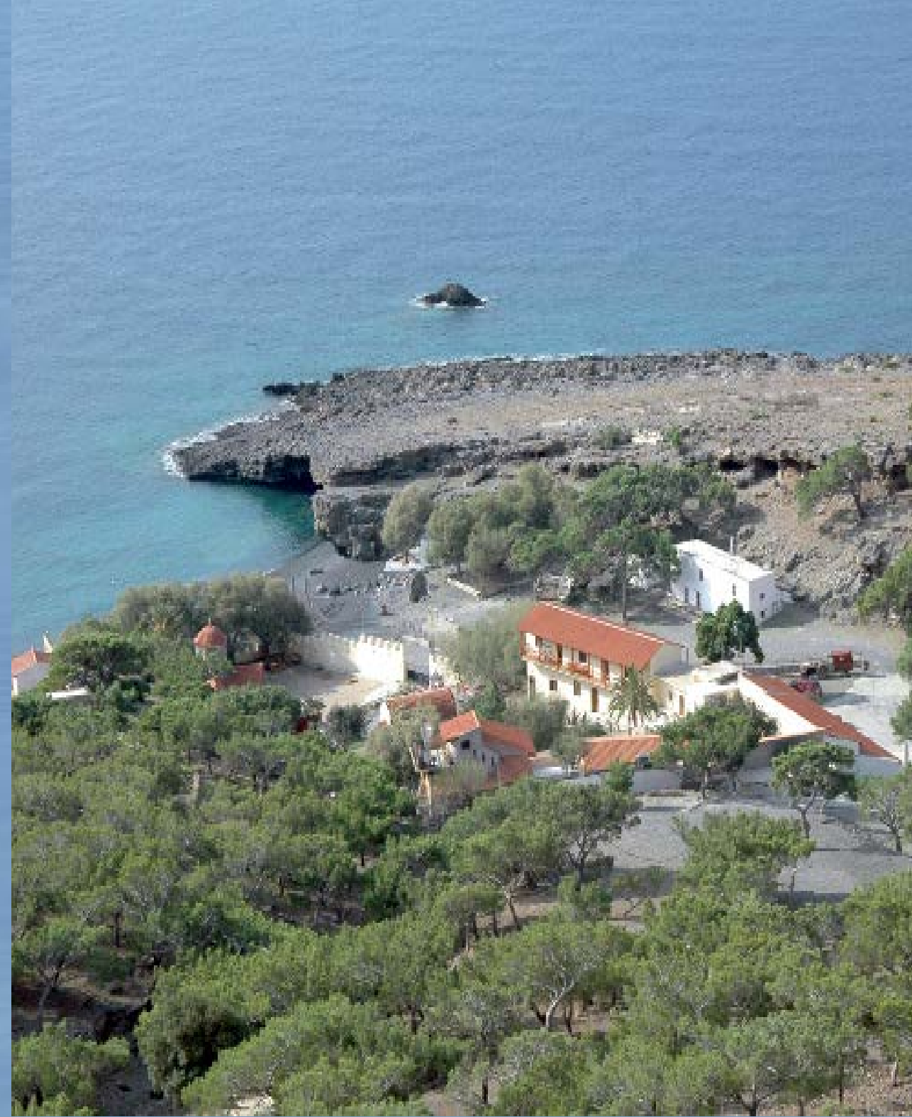
Ἡ παρά τῷ Λυβικῷ Πελάγει Ἱερά Μονή τοῦ Κουδουμᾶ.