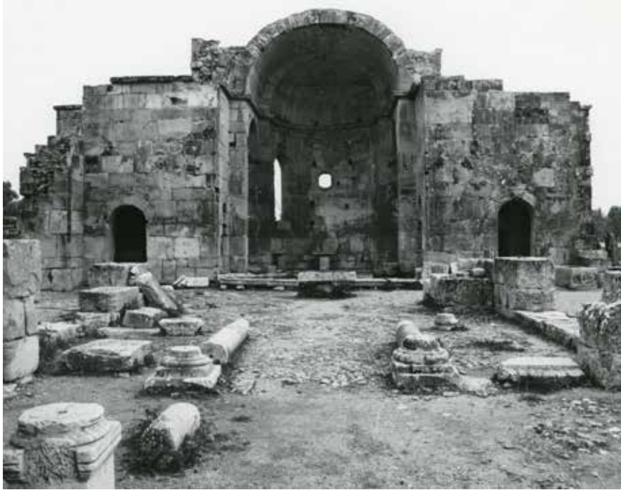
Γόρτυνα, Ἱερός Ναός Παναγίας Κερᾶς ἢ Ἁγίου Τίτου.